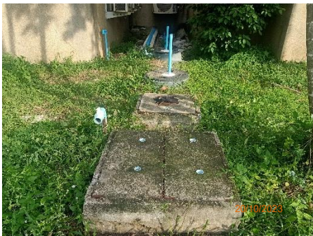
ภาพที่ 2.2-4 บ่อเกรอะ-บ่อซึม และถังกรองไร้อากาศ