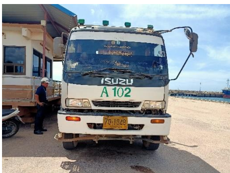
ภาพที่ 2.2-17 สัญญาณไฟกระพริบของรถบรรทุก