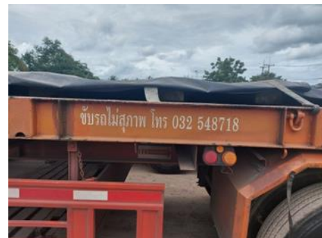
ภาพที่ 2.2-32 ป้ายแสดงหมายเลขโทรศัพท์ที่รถบรรทุก