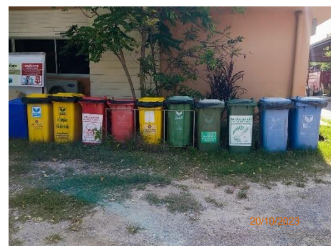
ภาพที่ 2.2-24 ถังขยะภายในโครงการแยกประเภท