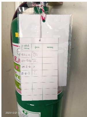
ภาพที่ 2.2-34 อุปกรณ์ป้องกันและระงับอัคคีภัย