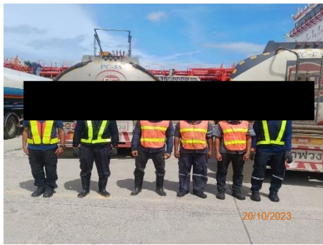
ภาพที่ 2.2-8 พนักงานใส่อุปกรณ์ป้องกัน อันตรายส่วนบุคคล