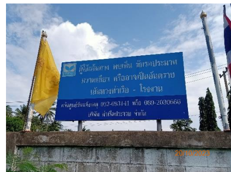
ภาพที่ 2.2-16 ป้ายแจ้งช่องทางร้องเรียนปัญหาจราจร