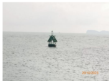
ภาพที่ 2.2-22 ทู่นสัญญาณไฟนำร่อง