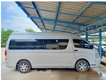
ภาพที่ 2.2-31 รถรับส่งผู้ป่วยไปสถานพยาบาล