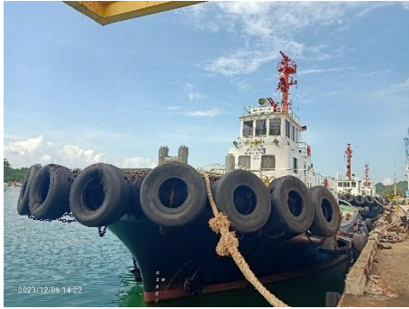
ภาพที่ 2.2-27 เรือดับเพลิง