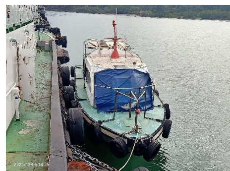
ภาพที่ 2.2-26 เรือเร็ว