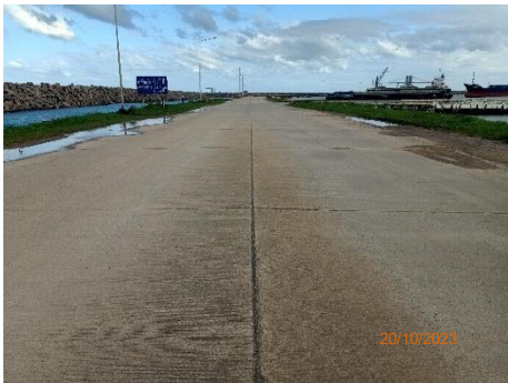
ภาพที่ 2.2-2 บริเวณพื้นที่ท่าเรือ