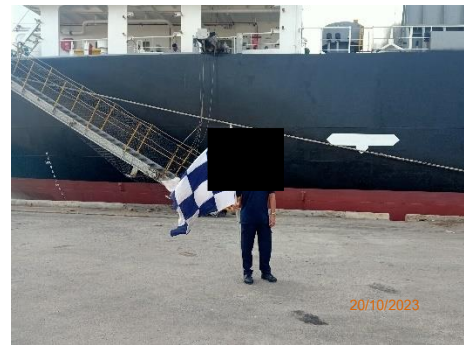
ภาพที่ 2.2-20 พนักงานควบคุมการจราจร ประจำท่าเทียบเรือ