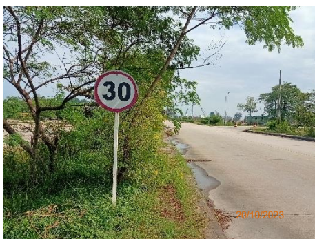
ภาพที่ 2.2-10 ป้ายจำกัดความเร็ว