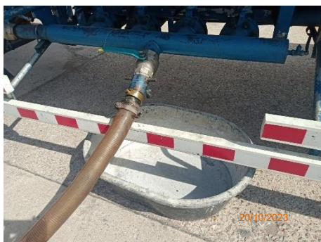
ภาพที่ 2.2-6 ถาดรองน้ำมันบริเวณเชื่อมต่อ