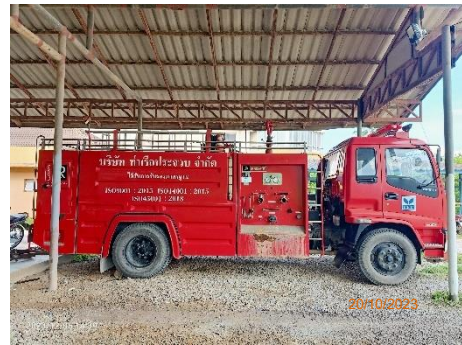
รถดับเพลิง