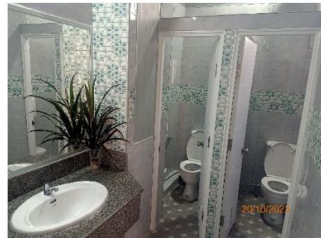
ภาพที่ 2.2-3 ห้องน้ำ