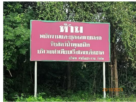
ภาพที่ 2.2-9 ป้ายห้ามจับสัตว์น้ำ