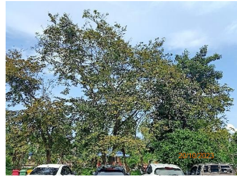
ภาพที่ 2.2-1 พื้นที่สีเขียว