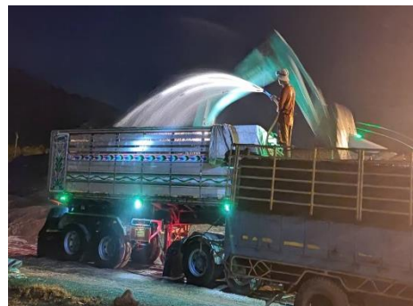
ภาพที่ 2.2-36 การปิดคลุมกองสินค้า/การฉีดพรมน้ำ สินค้าประเภทเทกอง