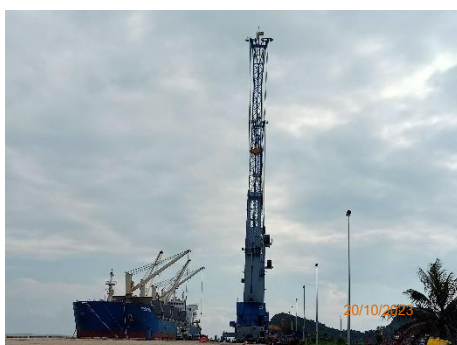
ภาพที่ 2.2-25 Mobile Crane