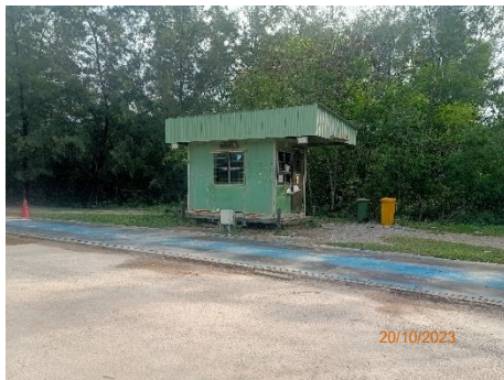
ภาพที่ 2.2-19 พื้นที่ขังน้ำหนักรถบรรทุก