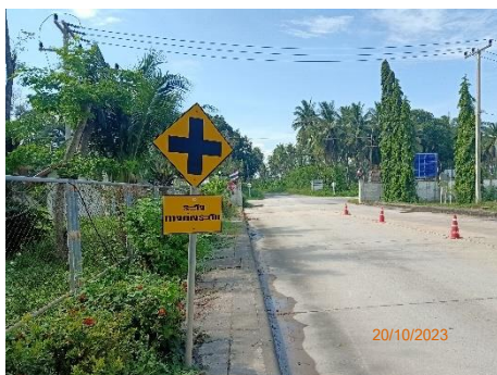
ภาพที่ 2.2-12 ป้ายสัญลักษณ์จราจร