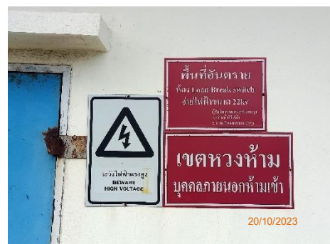
ภาพที่ 2.2-33 ป้ายบอก/ป้ายเตือน