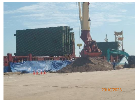
ภาพที่ 2.2-7 การชิงผ้าใบระหว่างเรือสินค้ากับหน้าท่า