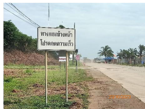
ภาพที่ 2.2-11 ป้ายเตือนลดความเร็ว บริเวณทางร่ว่งเข้า-ออกโครงการ