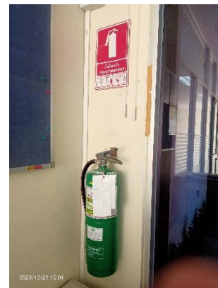
ภาพที่ 2.2-35 การตรวจสอบสภาพอุปกรณ์ดับเพลิงโดยบริษัทผู้จำหน่าย