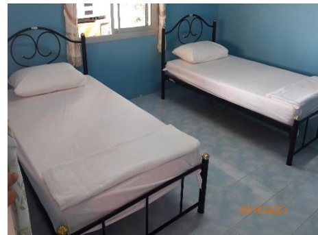
ภาพที่ 2.2-30 ห้องปฐมพยาบาล