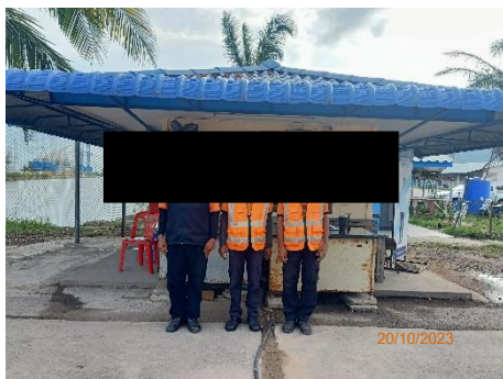
ภาพที่ 2.2-15 ป้อมยามรักษาการณ์