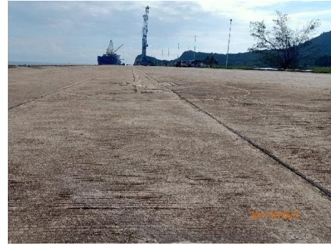
ภาพที่ 2.2-28 พื้นที่กองสินค้าเทกอง