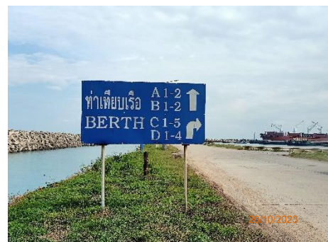
ภาพที่ 2.2-18 ป้ายแสดงเขตพื้นที่ท่าเรือ