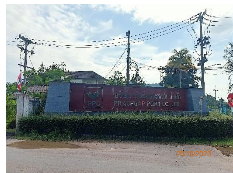
ภาพที่ 2.2-13 ป้ายชื่อหน้าโครงการ