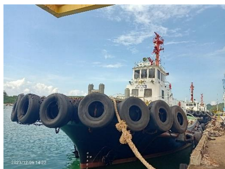
ภาพที่ 2.2-23 เรือ Tug