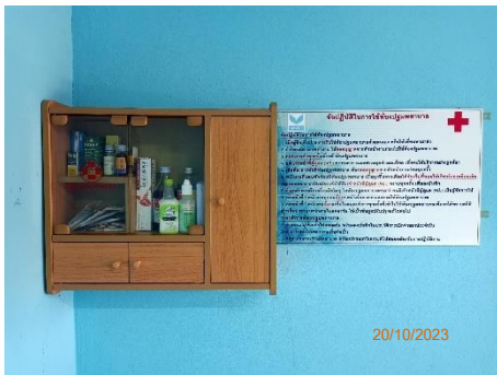
ภาพที่ 2.2-29 ตู้ยาสามัญประจำบ้าน