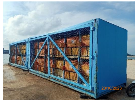
ภาพที่ 2.2-5 ตู้กักน้ำมัน